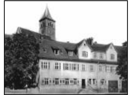
Links Schulhaus von 1820, rechter Teil Rathaus. Postkarte um 1950

Es gab Vorwürfe, formuliert an das Mutterhaus, die Diakonissin habe die Frau 'Lammwirtin' beleidigt, eine Wöchnerin nur einmal besucht, am Sonntag komme sie nicht zur Kirche und sei gar tageweise